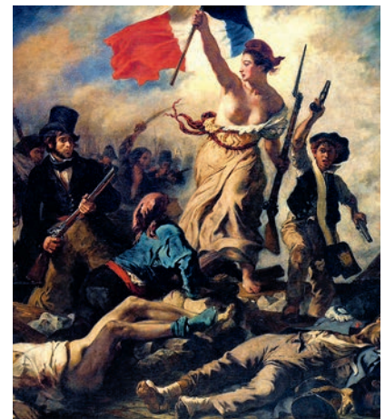
Obra del pintor romántico Delacroix. La mujer que representa la libertad hondea la bandera tricolor, que es símbolo de libertad y de Francia.