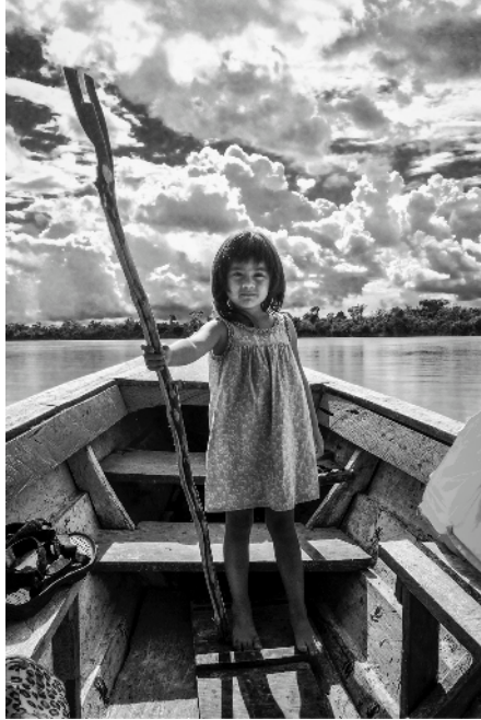
Título: Niña con vara (2014) Autor: Yayo López

¿Recuerdas la foto Niña con vara que viste la semana pasada? Vuelve a observarla e imagina una historia para esta foto: ¿Qué habrá pasado antes de ese momento?, ¿qué habrá pasado después?