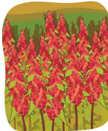
Planta de la quinua 2

Este grano o cereal proviene de la planta que lleva el mismo nombre: quinua.