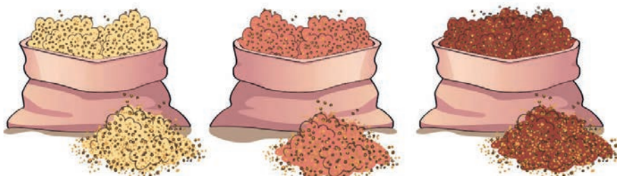
Tipos de quinua 3

Existen 3 000 variedades de quinua y los principales países que la producen son Perú, Bolivia, Ecuador, Chile y Argentina.