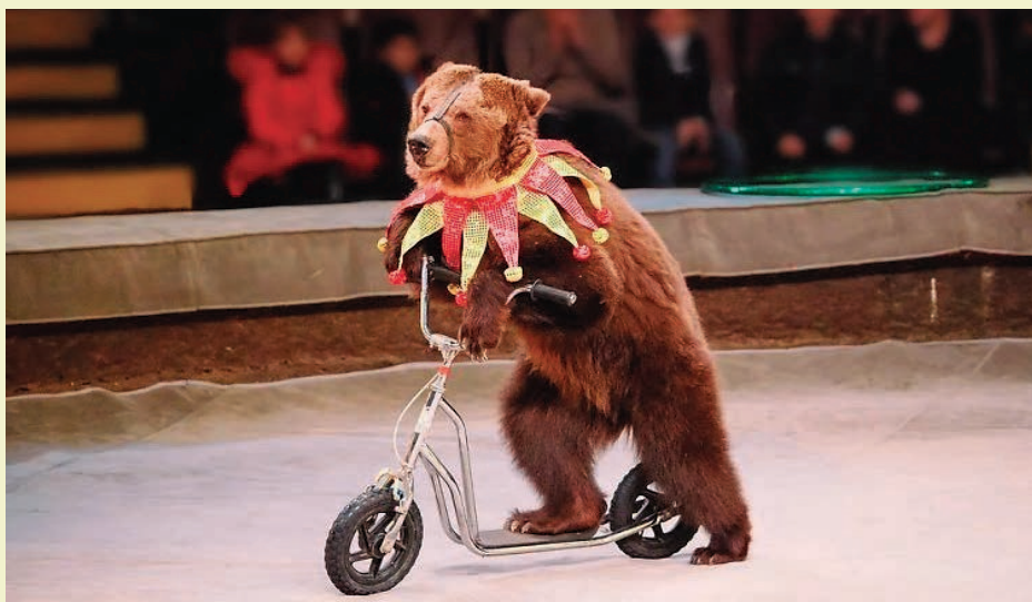
Birabent, M. (1970). El oso [Grabada por Estudios TNT]. En Treinta minutos de vida [disco] Discográfica Mandioca.

Ahora piso yo el suelo de mi bosque, otra vez el verde de la libertad . Estoy viejo pero las tardes son mías, vuelvo al bosque, estoy contento de verdad.